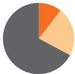
Asie du Sud