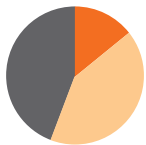
Asie de l'Est et Pacifique